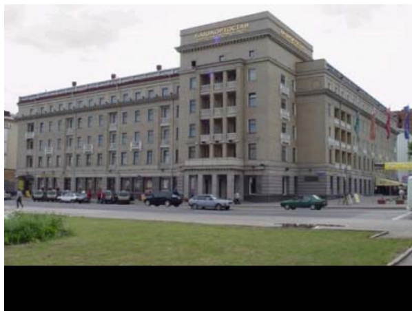
Гостиничный комплекс «Башкортостан»

«Ранний заезд»: Участники, прибывающие в гостиницу рано утром и сообщившие об этом организаторам (путем заполнения соответствующей графы в форме “Travel and accommodation”, или в отдельном сообщении), смогут заехать в гостиницу сразу после приезда, независимо от того, насколько рано они прибудут (гостиницы будут оповещены). В случае гостиницы «Азимут», для участников, прибывающих утром, номера будут забронированы с предыдущей даты, чтобы гарантировать ранний заезд (до 12:00) (согласно правилам данной гостиницы).