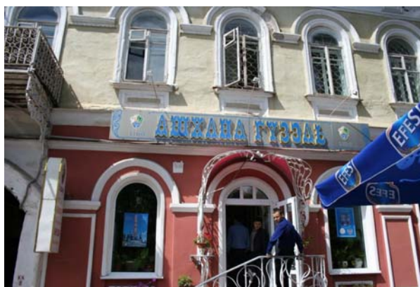
бистро «Ашхана Гузель»