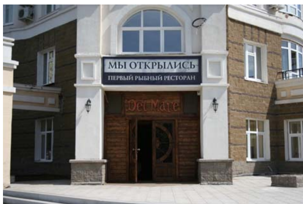
Ресторан «Дель Мар»

Завтраки включены в стоимость проживания в гостиницах (кроме гостиницы УГАТУ – guesthouse). Оплата обедов и ужинов не включена в регистрационный взнос, соответственно их участники оплачивают сами. В рабочие дни симпозиума (с 15 по 18 августа), участники могут пообедать в столовой Дома Профсоюзов (рекомендуемый вариант), либо в одном из близлежащих ресторанов/бистро. На последней странице помещена карта, на которой указано месторасположение ресторанов/бистро. Также в здании гостиницы «Башкортостан» (около места конференции) имеется супермаркет (часы работы с 8:00 до 23:00), где вы можете приобрести свежие продукты и готовые блюда.